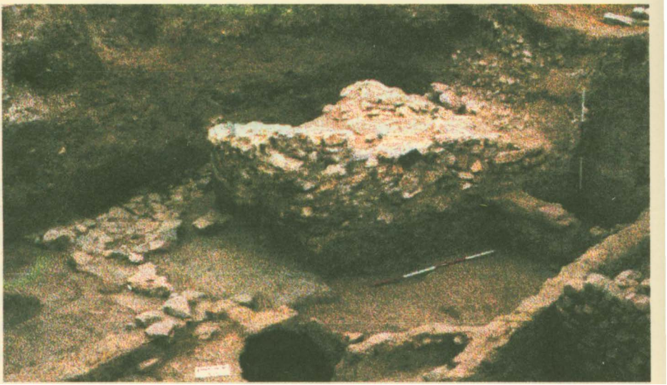
12. yüzyılda Dorylaion Kalesi'nden görünüş

Ne var ki, Bizans Anadolu'ya yeniden hâkim olmak için Dorylaion ve çevresini ele geçirmek gerektiğinin bilincindeydi. Bunu gerçekleştirmek